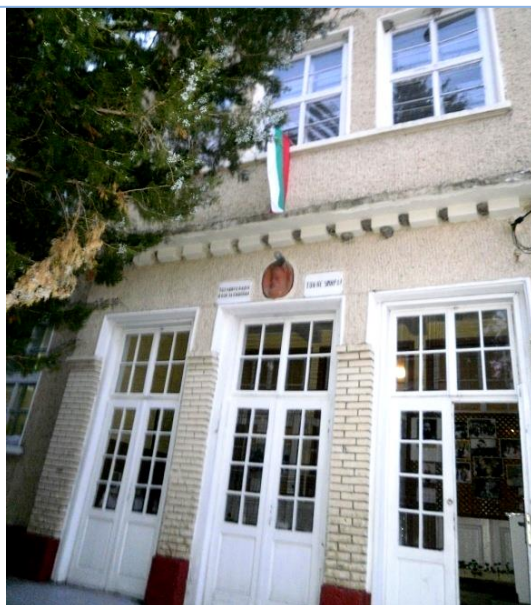
Сградата на ОУ „Христо Ботев“, с. Вардун от 1935 год.